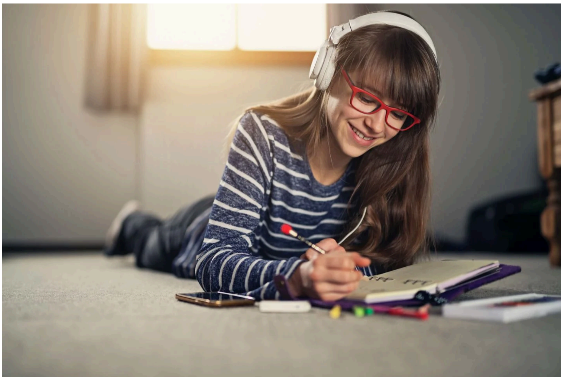
Aider son enfant à bien utiliser son agenda scolaire