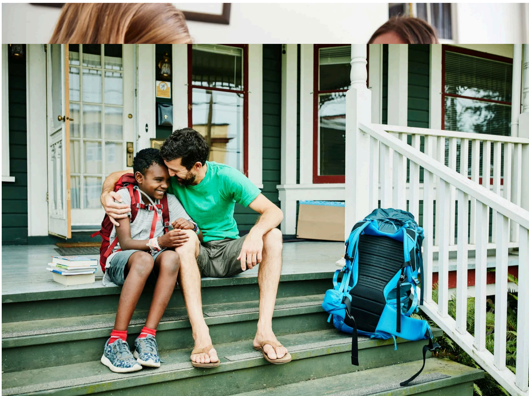
Comment gérer mes attentes envers mon enfant